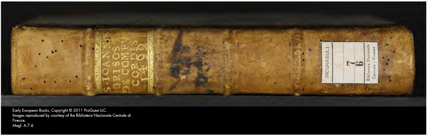
Magl. A.7.6